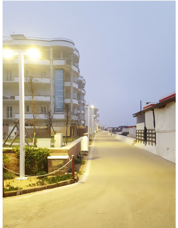
Ingresso sud della ciclopedonale di Francavilla