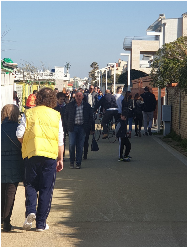
Vista della ciclopedonale di Francavilla e della sua fruizione in orario di punta