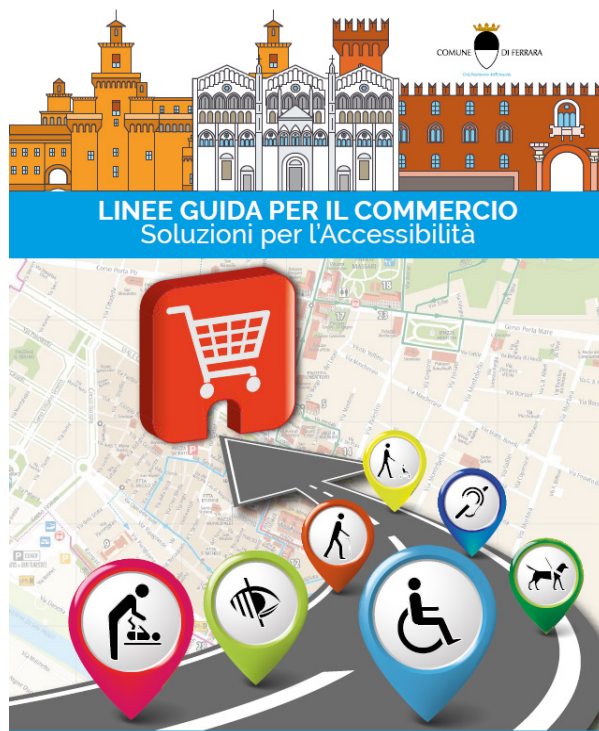
Linee guida per il commercio - Soluzioni per l'accessibilità

Le schede che compongono le Linee guida forniscono indicazioni di merito sul come realizzare servizi, strutture e attrezzature che abbiano funzionalità per tutti. In tal senso le schede trattano il sistema dei parcheggi fornendo indicazioni circa la loro individuare attraverso il CUD (Contrassegno Unico Disabili Europeo) realizzato delle dimensioni previste dal Codice della Strada avendo cura al contempo di collocarlo nelle immediate vicinanze della struttura; di prevedere, ove possibile, una copertura del parcheggio e del percorso; di garantire che tutto lo sviluppo del percorso risulti completamente accessibile e ben segnalato.