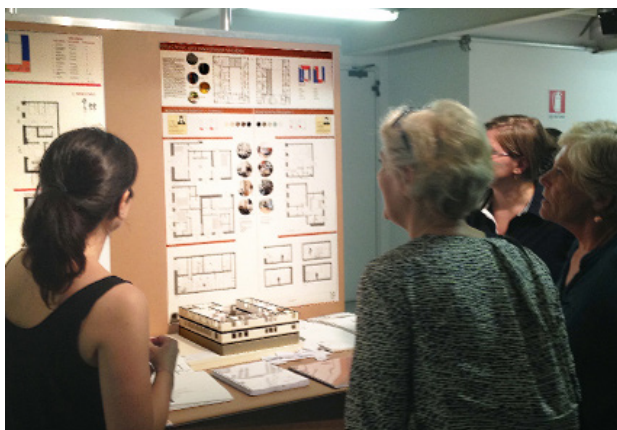
LABORATORIO DI PROGETTAZIONE ALLA SCUOLA DEL DESIGN DEL POLITECNICO DI MILANO - 2016