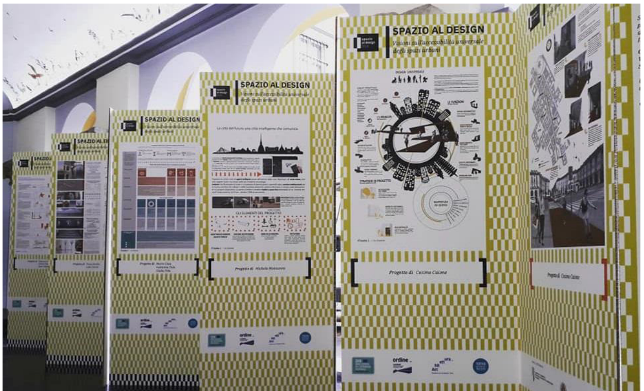
Tavole espositive dei risultati del contest Spazio al design

ed associazioni del territorio direttamente interessate, l'iniziativa ha ricevuto il patrocinio di: MIBACT, con il sostegno della Soprintendenza di Torino; Città Metropolitana di Torino; Regione Piemonte; AMP - Agenzia Mobilità Piemontese; Torino Creative City Unesco; Città di Torino; Circoscrizione 1, Torino; Fondazione Accorsi – Ometto; Politecnico di Torino; Università di Torino; IAAD.