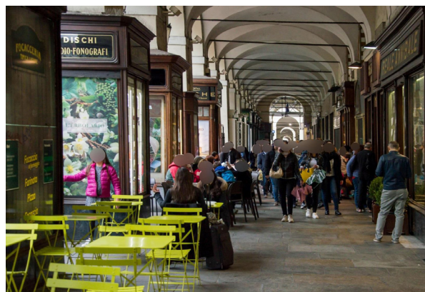
Vista di un portico su Via Po, con edicole e vetrine degli esercizi commerciali

Giovani professionisti del design e dell'architettura si sono cimentati nella progettazione di soluzioni che gli operatori si sono impegnati ad adottare, a proprie spese, presso le proprie attività. La soluzione risultata vincitrice, ora in fase di messa a punto e realizzazione, è stata quella di una rampa avvolgibile, da inserire per accedere alle attività commerciali.