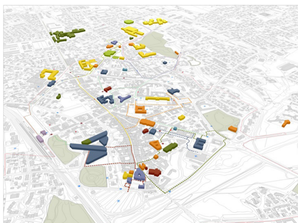
Tavola di sintesi del P.E.B.A. di Pordenone

Info marco.toneguzzi@comune.pordenone.it Tel. 0434/392491