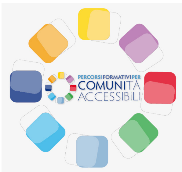
Logo del progetto "Percorsi formativi per comuni accessibili"