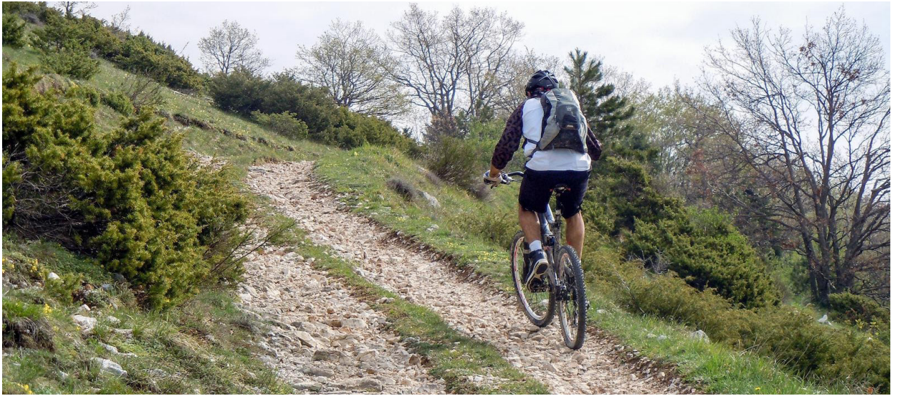
Tratto di percorso nel Comune di Sefro