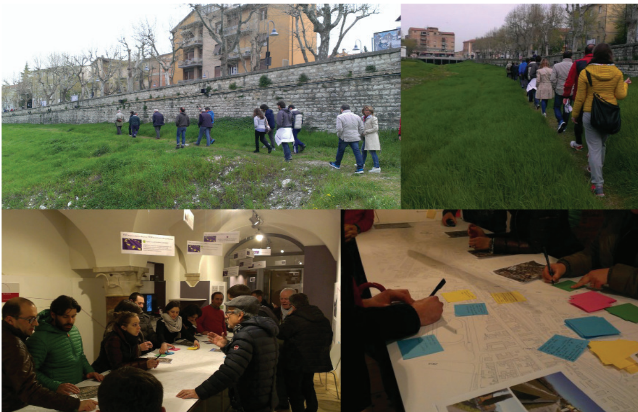
"Passeggiata urbana" e incontri partecipativi svolti nella sede dell'Urban center nell'ottica dell'accessibilità alle scelte progettuali.