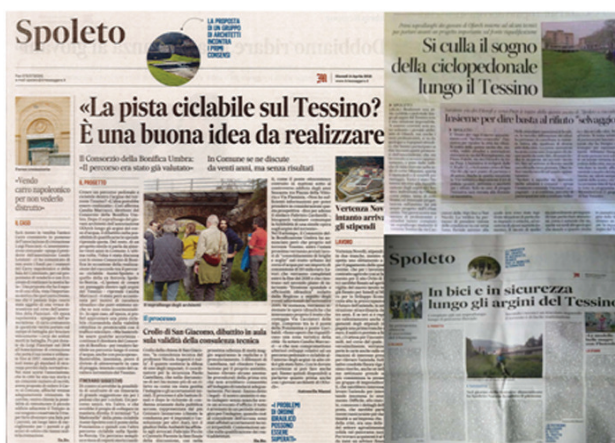
La rassegna stampa relativa ai workshop.